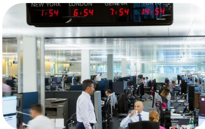
Трейдинговый зал Pictet Group

В соответствии с высокими стандартами надежности и безопасности архитектура сети на основе системы WEYTEC Distribution Platform обеспечивает максимальную работоспособность ИТ-оборудования и непрерывность процессов, необходимых для ведения бизнеса. Решение включает в себя два серверных помещения и полностью аппаратно-интегрированную основную сеть с высокой пропускной способностью и резервированием коммутаторов ядра.