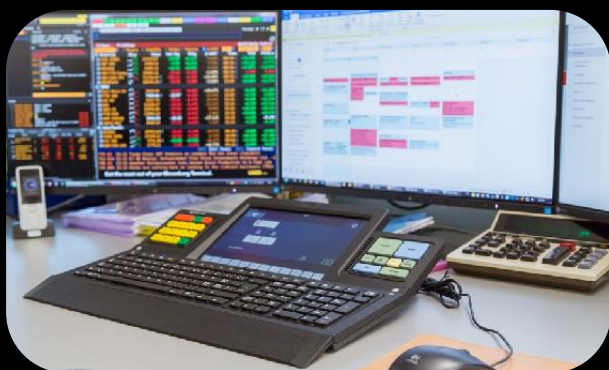
Рабочее место с клавиатурой WEYTEC Smart Touch