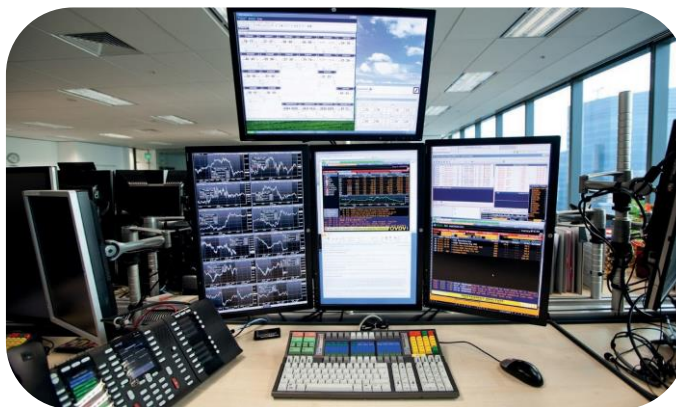
Рабочее место в трейдинговом зале банка Julius Baer в Сингапуре

Трейдинговый зал банка Julius Baer в деловом центре Asia Square является одной из самых высокотехнологичных торговых площадок в Азии. Решения компании WEYTEC помогли создать более спокойную и комфортную обстановку для работы трейдеров, что повысило эффективность торговли. Благодаря технологиям Capture и Focus трейдер может легко и интуитивно управлять всеми основными сервисами, источниками и приложениями, используя меньшее количество дисплеев и всего одну многофункциональную клавиатуру.