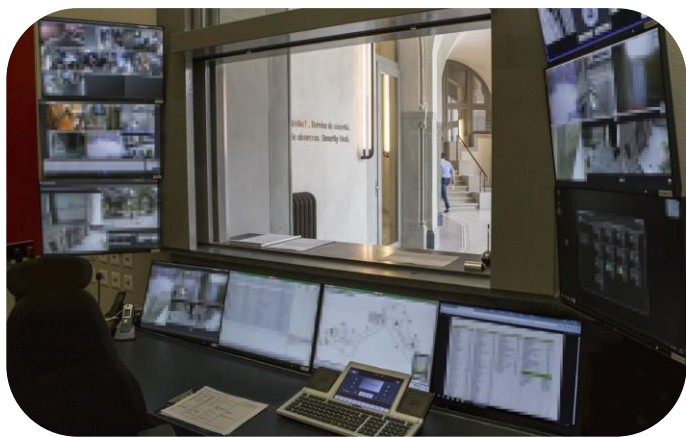
Новый пост охраны: виден каждый уголок музея

Платформа WEYTEC Distribution Platform объединяет и распределяет сигналы между оборудованием серверного помещения и постом охраны. Сотрудники на посту охраны контролируют все сетевые источники и системы наблюдения и управляют ими с помощью клавиатур WEYTEC Smart Touch. Они могут переключаться между источниками сигнала и выводить изображение с камер и другую информацию на мониторы одним нажатием кнопки.