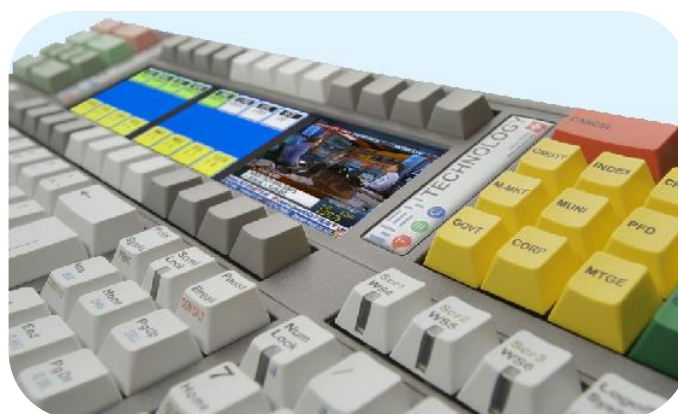
Многофункциональная клавиатура WEYTEC MK06

Полностью интегрированное решение WEYTEC Distribution Platform помогло объединить 54 новых высокопроизводительных рабочих места в трейдинговом центре в Бендерне и 15 мест в резервном трейдинговом зале, расположенном в другом здании. Такая архитектура позволила переместить все 120 компьютеров, которые ранее располагались под рабочими столами трейдеров, в центры обработки данных.