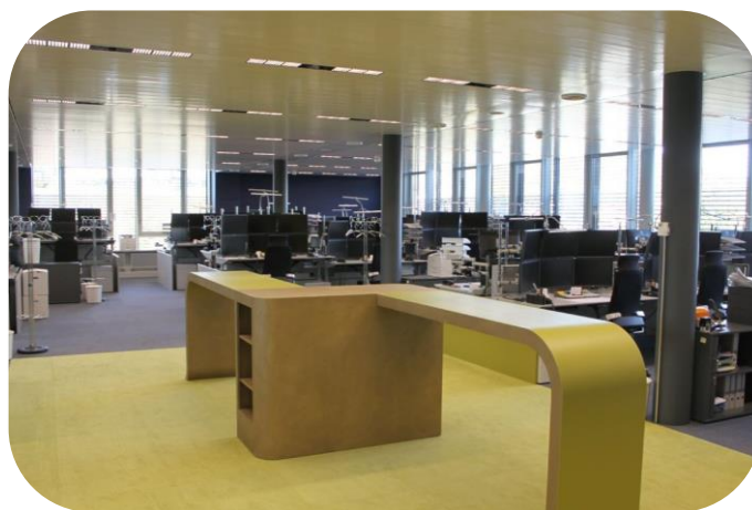
Новый трейдинговый зал LGT

Условия работы в трейдинговом зале значительно улучшились после того, как ПК были перенесены в центральное серверное помещение. Это позволило снизить уровень шума и запыленности в помещении, а также свести к минимуму тепловыделение и электромагнитное излучение. И, что немаловажно, больше не возникало необходимости в кондиционировании рабочей зоны, что позволило упростить дизайн офиса и добиться значительной экономии средств и электроэнергии.