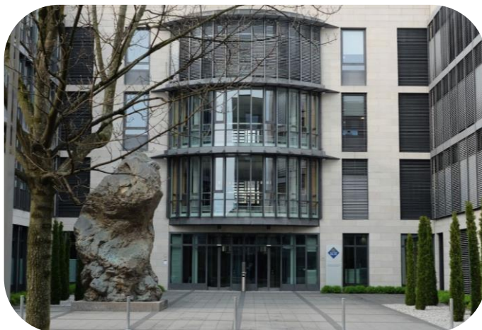
Трейдинговый центр в Бендерне (Лихтенштейн)

LGT – крупнейшая в мире финансовая группа, обслуживающая состоятельных клиентов и управляющая их активами. Группу LGT уже более 80 лет возглавляют члены семьи княжеского дома Лихтенштейна – плеяда выдающихся бизнесменов, уникальная даже для бизнеса такого уровня. LGT обладает обширным опытом в структурировании и управлении крупным семейным капиталом. На основе этого опыта LGT разрабатывает и внедряет свои решения. По данным на конец 2013 г., группа LGT управляет активами на сумму 110,7 млрд швейцарских франков. У LGT открыто более 20 филиалов по всему миру, в которых работают примерно 1 900 сотрудников.