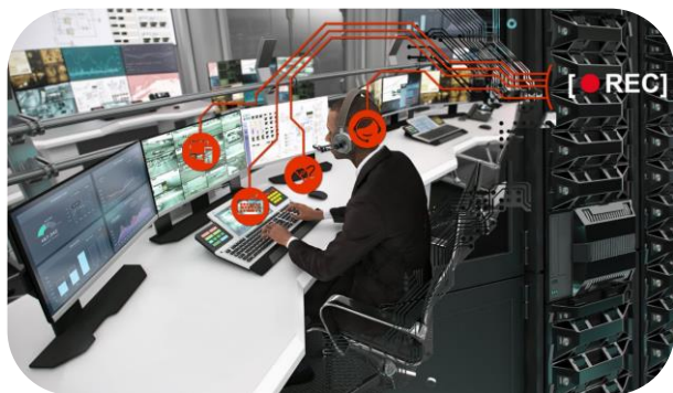
Регистрация действий оператора на рабочем месте, изображений с экрана, движений мыши, нажатий на клавиши и аудиоданных

Rheinmetall поставляет системы безопасности Вооруженным силам Швейцарии, которые ежегодно оказывают кантону Граубюнден поддержку в обеспечении общей безопасности во время проведения Всемирного экономического форума (ВЭФ) в Давосе (Швейцария). Вооруженные силы Швейцарии отвечают за защиту воздушного пространства: для этого используются системы ПВО воздушного и наземного базирования. Благодаря наличию надежной наземной системы ПВО, вооруженной 35-мм зенитными установками, истребители взлетают на перехват только в крайнем случае. Управление системой ПВО осуществляется из оперативного центра ВВС Швейцарии, который включает в себя несколько рабочих мест операторов (пункт управления 1) и одно рабочее место начальника ПВО (пункт управления 2). Эти рабочие места оборудованы системой регистрации действий оператора на рабочем месте (Evidence Capture). За пределами оперативного центра есть еще одно рабочее место, где осуществляется планирование миссий и где можно воспроизвести последовательность событий при разборе инцидентов.