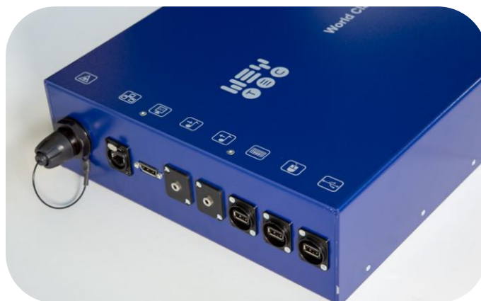
Изготовленное по спецзаказу настольное шасси

Для операторов и начальников оперативных центров компания Rheinmetall изготовила уникальные шасси для приемных карт в соответствии с военными спецификациями и стандартами. Изготовленное по спецзаказу шасси оснащено прямыми (без разветвителей) разъемами для оптоволоконных кабелей. WEYTEC разрабатывает и производит свои решения в соответствии с высочайшими стандартами качества на собственном предприятии в Швейцарии.